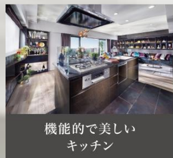
機能的で美しい キッチン