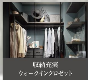
収納充実 ウォークインクローゼット