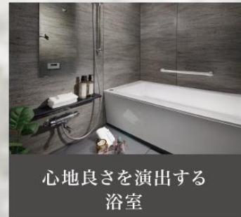
心地良さを演出する 浴室