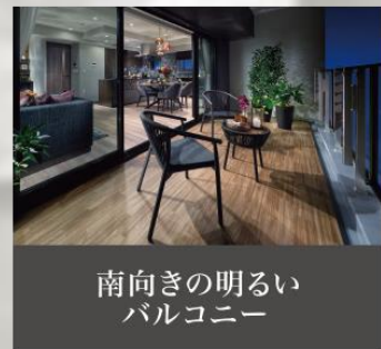
南向きの明るい バルコニー