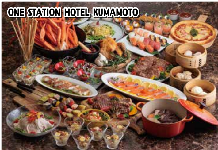
ONE STATION HOTEL KUMAMOTO