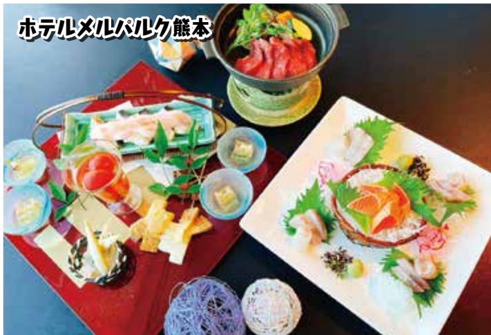
ホテルメルパルク熊本