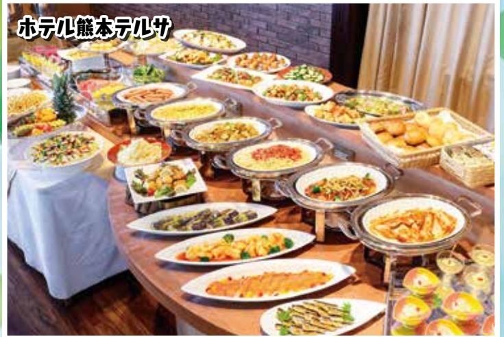
ホテル熊本テルサ

会員1人につき1ホテル(2名分) ご提供します。 ※申込詳細はP2をcheck!