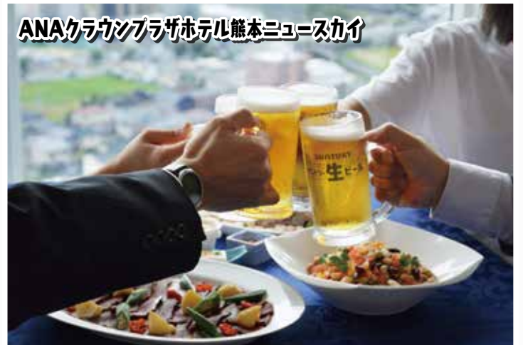
ANAクラウンプラザホテル熊本ニュースカイ

利用期間：7月1日～8月31日 ※一部適用除外日有 ★ふれあう共済から、料金の一部を補助しています